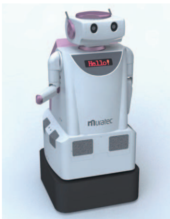
会場にて実演展示します。