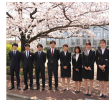
新入社員研修中、満開の桜の前で撮影!

体でのシナジーを発揮し、これまでOA事業で築いてきた全国規模のメンテナンス体制を強みに、中堅規模の製造業を対象にDX推進による業務革新を実現するシステムの納入を進めていく。これらの取り組みによって、3年後の2025年3月期には売上高100億円を目指す。