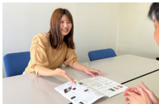
営業職の女性社員も活躍