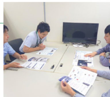
社内勉強会の様子