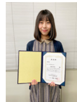
電話対応コンクール京都府大会で2年連続入賞